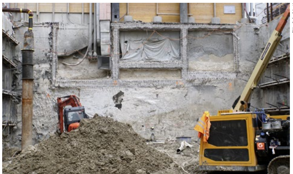
In drei Untergeschossen wird ein automatisches Parksystem für Autos eingerichtet. Eine Velorampe führt zur bestehenden Unterführung mit Abstellplätzen (Bildmitte).

«Die grösste Arbeit im Bereich der Baugrube ist eigentlich vorbei», sagt Mitt erleichtert. Und für Koehly ist ein Gebäude wie der Franklinturm ein Höhepunkt in der beruflichen Tätigkeit. «Allenfalls kommt einmal im Leben die Chance, sowas zu bauen.» ■