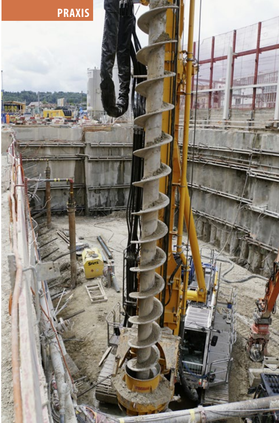
Der grösste Teil der 152 Fundationspfähle befindet sich bereits im Baugrund. Das Fundament des Franklinturms im sandigen Lehmboden besteht aus einer Kombination von Pfahl- und Flachgründung. (Bild: Bohrschnecke bereitet Pfahlgründung vor.)

waschungsdispositiv mit Messgeräten aufgezogen. Die Fundationspfähle sind je nach statischer Last unterschiedlich verteilt.