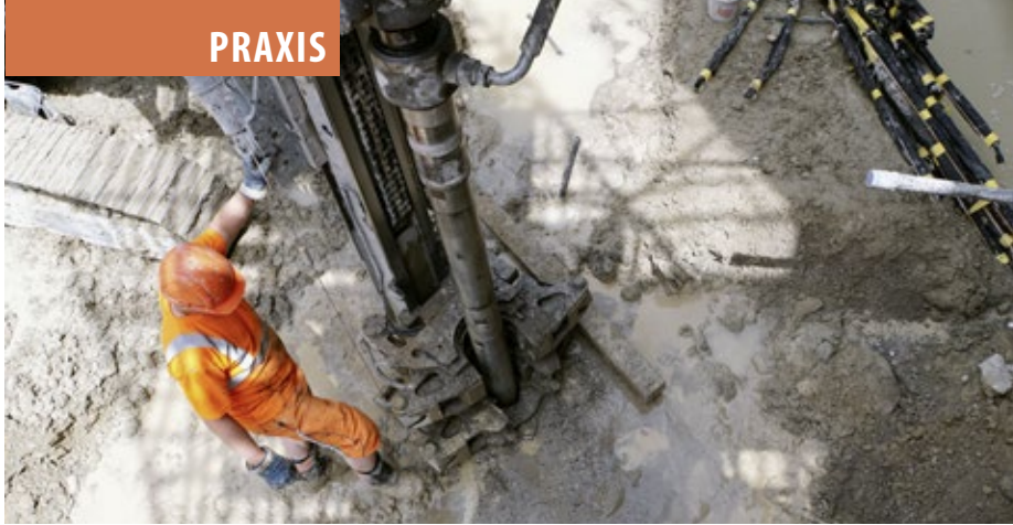
Mittels Filterbrunnen auf der Sohle der Baugrube wird der Grundwasserspiegel abgesenkt. Um dort den Druck zu verringern, pumpt ein Wellpoint-System im Umfeld der Baustelle Wasser ab.